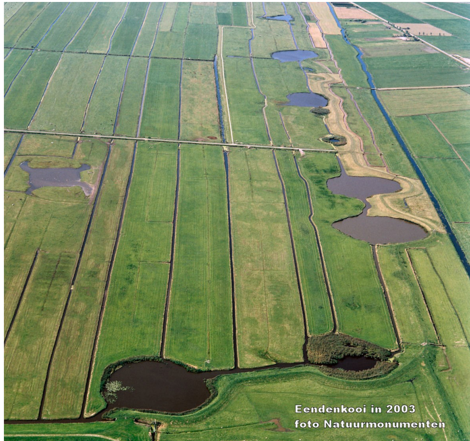
Eendenkooi in 2003

Of geniet van de polder wandelend over het Nesserpad, het klompenpad dat begint bij de oude haven of via de zomerdijk, bereikbaar via het pad dat start aan het eind van de Meentweg.