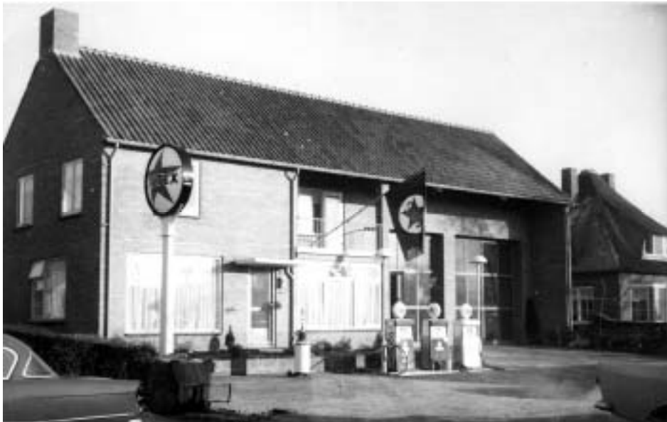
Vernieuwde garage Koot (ca. 1962).

Al in de tijd van Wim van IJken stond er één pomp. Die nam Kees in 1956 over. Na een korte periode met twee pompen werden het er uiteindelijk drie. Dat bleef ook zo na de nieuwbouw in 1962. Rob: “Op zondag was de benzine-