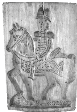
Speculaasplank van bakkerij Heek voor een speculaasruiter van 2 pond.

Vele jaren, met name in de tijd van mijn grootvader, werkte Ger Scherpenzeel van de Meentweg bij ons als