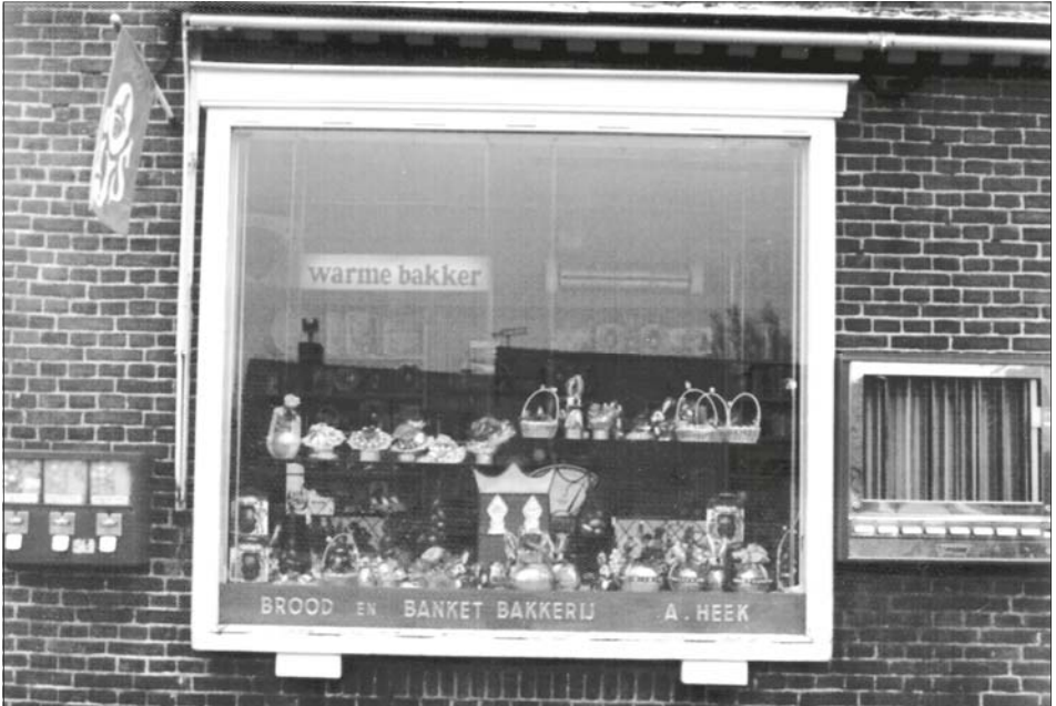
Etalage van bakkerij Heek op Wakkerendijk 3 na de verbouwing van 1958.

't Klooster van de Boerenleenbank had eens gezegd: "Ze moet die fiets zeker verdienen"). Mijn broer en ik hadden op een gegeven moment allebei een eigen wijk.