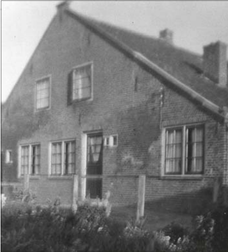
Achterzijde van het pand Kerkstraat 8-12. Gefotografeerd circa 1960.